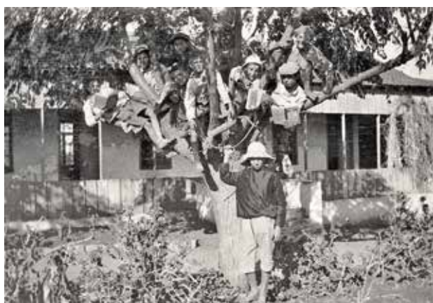
ילדי בית הספר בראשון לציון, 1917

מפעלם החינוכי של לובמן וחבריו המורים נשא פרי חרף קשיים רבים שעמדו בדרכם – כגון היעדר תכניות לימודים