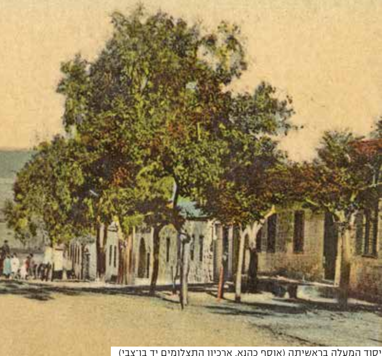
יסוד המעלה בראשיתה

לובמן היה שותף בקביעת ניסוחו הסופי של ההמנון הלאומי, התקווה, בעת שמחברו שהה בראשון לציון. לדברי דוד יודילוביץ "הכרנו את הכותב הנ"ל [נ"ה אימבר], בשעת חברו את השיר, וגם הגהנו אותו (את השיר), עשינו תיקונים בסגנון הלשון שלו וגם בתוכן (בצותא דישראל בלקינד, ומרדכי לובמן ודוד עבדכם)". בעוד שאימבר כתב במקור "עוד לא אבדה תקותנו/ התקוה הנושנה/ לשוב לארץ אבותינו/ עיר בה דוד חנה", מספר יודילוביץ, "אנו שנינו ככה: 'עוד לא אבדה תקותנו/ התקוה משנות אלפיים/ להיות עם חפשי בארצנו/ ארץ ציון וירושלים'" (ראשון לציון, התרמ"ב 1882 – התש"א 1941, עמ' 508).