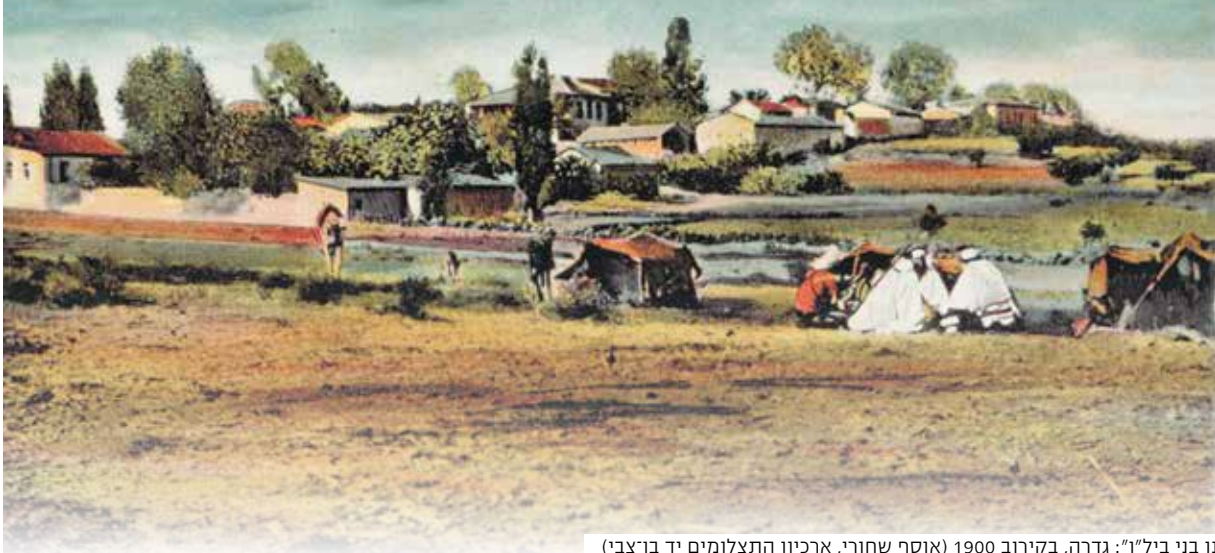
"מושבת חלוצינו בני ביל"ו": גדרה, בקיורב 1900

ופילג את היישוב בארץ ישראל). מכתביו חשפו את האורות בצד הצללים בחיי המושבות, וביטאו את עמדותיהם של חובבי ציון מרוסיה. בשנים 1888-1889 התפרסמו בעיתון "המליץ" רשמיו הביקורתיים על המצב במושבות יהודה, בחתימת "אליפז התימני". הוא כתב בכאב